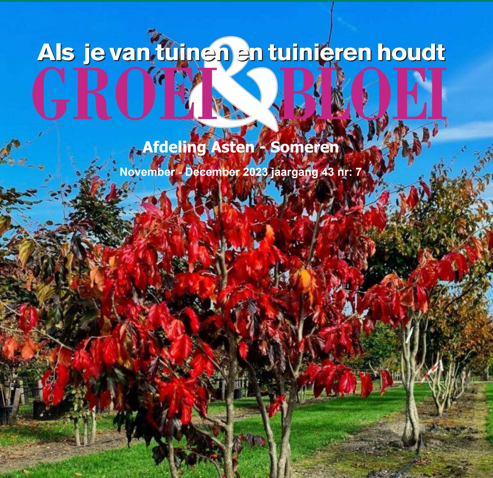
Parottia Persica "Bella"

November - December 2023 jaargang 43 nr: 7